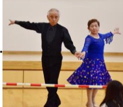
社交ダンスクラブ。ルンパとチャチャを演舞