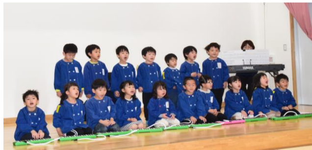
高田東部保育園の4歳児の合奏

館内では、ステージ発表や、絵画・工芸品などの展示。館外では、熊本高専の科学工作教室や、ヨーヨー釣り・スーパーボールすくい、綿菓子・ポップコーンの無料配布、野菜、魚類の販売、キッチンカーの出店があり、行事の締めはお楽しみ抽選会と終始にぎわいのあるイベントとなりました。