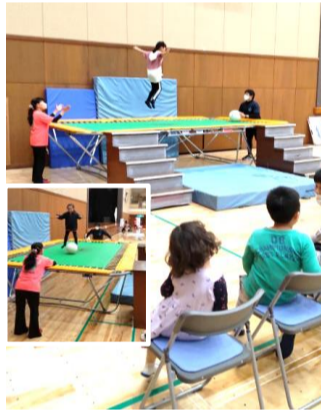
人気のトランポリン。順番を待つ子どもたち。