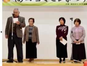
詩吟クラブの吟詠と朗詠。3曲を披露