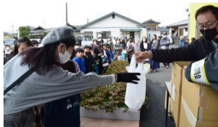
熱気を帯びたお楽しみ抽選会！