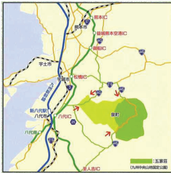
図1. 泉・五家荘ロードマップより一部転載