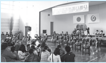
平成24年度 ふれあい祭り

現在、麦島城跡を含む「3つの城跡」を国指定の史跡に申請する計画があることから、協議会でも「麦島城跡」が校区のシンボルとなるよう、取り組んでいきたいと考えています。