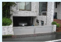
止水板(防水板)の設置