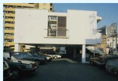
家屋のピロティ化