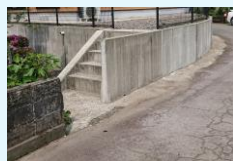
宅地や家屋、外構の嵩上げ