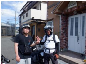
大阪の街は迷うので甥っ子に同行を依頼。渋滞に遭いながらも和歌山入り。