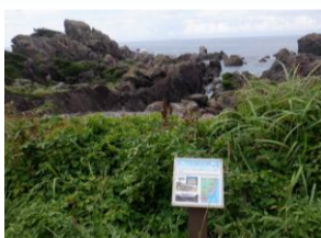
室戸岬で地層が分かれているとの説明書きが。岩の形状から波の荒さを実感。