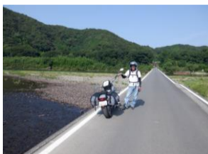
高知・四万十川の沈下橋。冠水しても橋が流されないよう欄干が無い。(怖い)