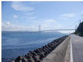
明石海峡大橋。香川県でうどんを食べられず…仕方なく淡路島でキャンプ。