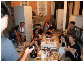
大阪の弟宅。夜は隣人家族を交えてBBQ。かつり飲み食いして漫才まで披露！