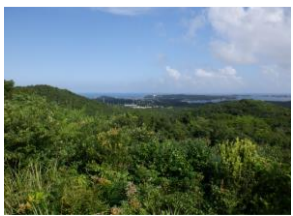
三重県志摩市。カーブと景観を楽しんだ。天気も最高。