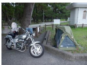
高知市桂浜近くの無料キャンプ場。公園も砂浜もきれいだっ