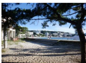
和歌山・シララ浜。温泉には入れず夕食と風呂だけ旅館で。浜では目を保養♡