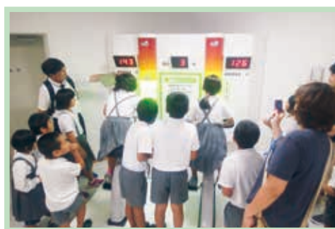
エコエイトやつしる施設見学の様子