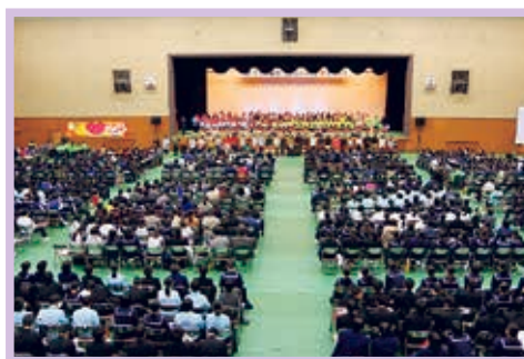
人権啓発イベントの様相