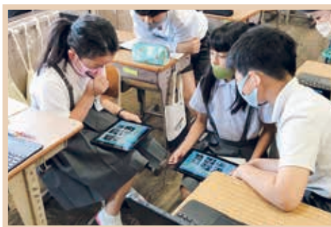
タブレット端末を効果的に活用した授業