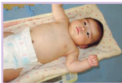
乳幼児健診 身体測定