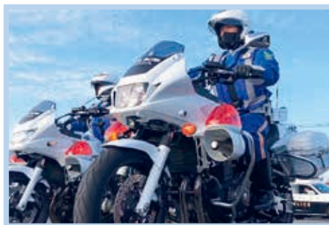
防犯パトロール出発式