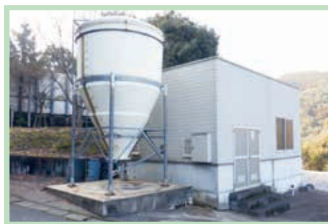
さかもと温泉センター(木質バイオマスボイラー)