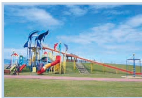
日奈久ドリームランド（複合遊具）