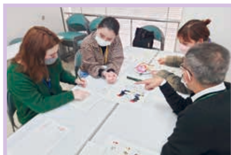
多文化共生の推進