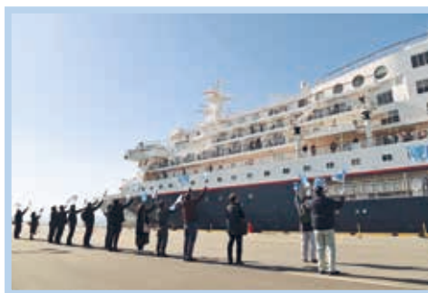
クルーズ船寄港の様子