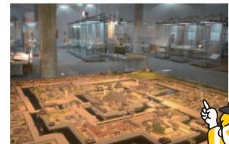
▲八代城模型は常設展示