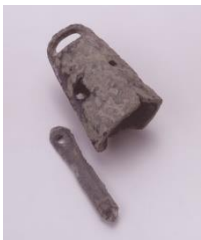
かみひおきめ おとぎいせき 上日置女夫木遺跡 出土小銅鐙