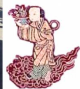
笠鉾狸々の水引幕から八仙人の図