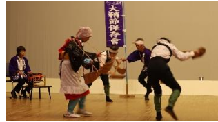
13:20~八代新地大鞆節保存会