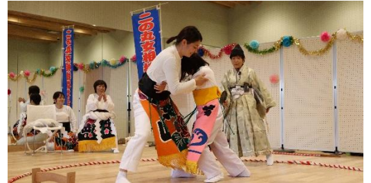
4年ぶり復活公演「女相撲」白熱の親子対決!

1月21日(日)に冬の一身体験 DAY を開催しました。八代の民俗芸能を身近なものに感じていただけたら幸いです。これからもお祭りのでんでん館では、民俗芸能を楽しむことができるイベントを開催していきます。あなたの“推し”は、どの民俗芸能でしたか?