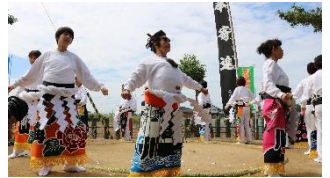
14:15~千丁町女相撲保存会