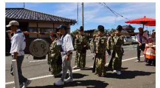
10:45~新牟田雅楽保存会