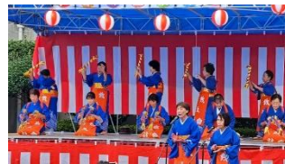
10:00~千丁町銭太鼓保存会