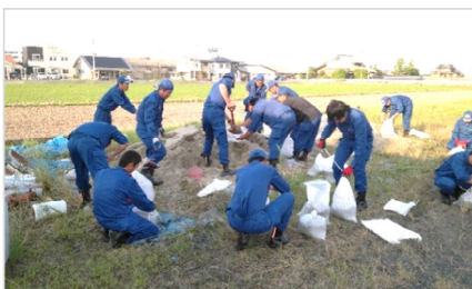
災害に備えて土のう作成