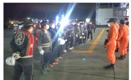
新入団及び幹部訓練