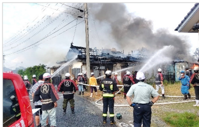
火災時の消火活動