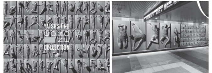
▲八代ごろ寝コレクション（渋谷駅で産量をPR）