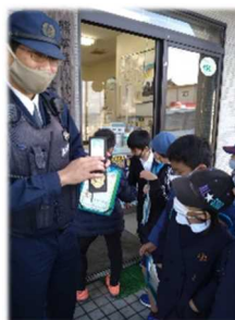
《郡築小 まち探検補助》

放課後子ども教室、まち探検補助、交通安全教室補助、田植え・稲刈り補助、からいも苗植え・収穫補助、ミシンボランティア、クラブ活動支援、学校除菌作業補助、学校行事写真撮影補助、地域探検活動見守り、避難訓練下校見守り、放課後学習会、別室登校児童の活動支援、習字指導補助、校内の樹木剪定・伐採補助、等