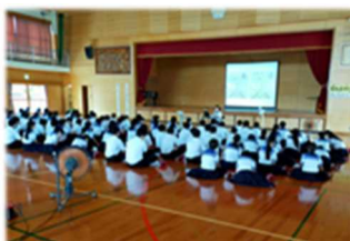
《二中 認知症サポーター養成講座》