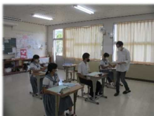
《二見中 地域未来塾》

地域未来塾、地域学習フィールドワーク支援、体育大会運営補助、家庭科支援(着物着付)、家庭科支援(裁縫)、技術科木材加工支援、美術授業支援、職場体験場所の発掘・連絡調整、職業講話講師依頼、認知症サポーター養成講座支援、引き渡し訓練支援、読み聞かせ、不登校生(別室)支援 等