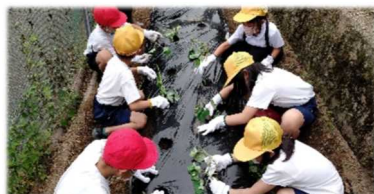
《泉小 芋の苗植え体験》