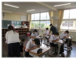
《日奈久中 サマースクール》