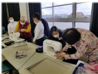
《文政小 ミシン授業補助》