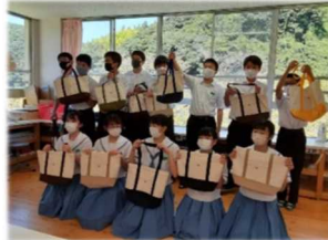
《東陽中 家庭科授業補助》