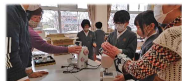
《宮地小 ミシン授業補助》