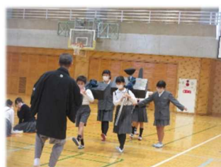
《松高小 妙見祭花奴体験》