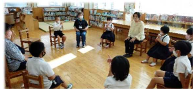
《泉小 放課後子ども教室》