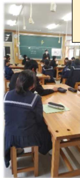
《八中 美術授業支援》