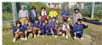
《八中 芋掘り体験支援》