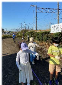
《有佐小 有佐駅清掃活動》