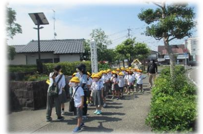
《松高小学校 まち探検6/8》