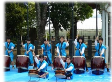
《昭和小学校 太鼓披露4 /11》

コロナ禍の中ですが、様々なアイデアを出し合いながら、今できることを確実に実践していきたいと考えております。今後も、地域・保護者の皆様のご理解とご支援、ご協力をよろしくお願いいたします。