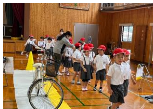
《代陽小・交通教室》