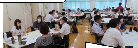
好きな飲み物も持ち込んで、和気あいあいとした話し合い