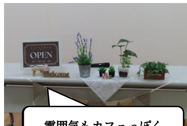
雰囲気もカフェっぽく