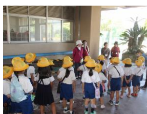
《郡築小・1年公園探検見守り》《宮地小・米づくり：種籾の選別》