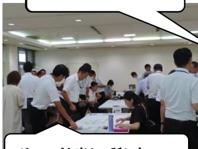
グループを変えて話し合い