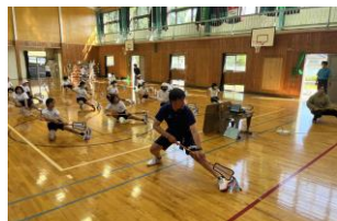
《二見小・雨乞い踊りの指導》