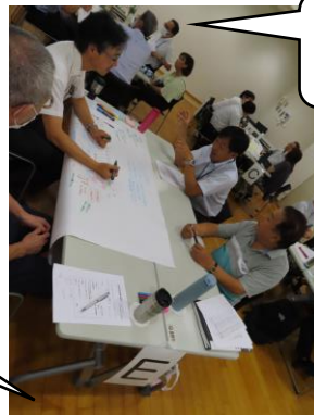
どんどん意見が出ています