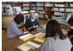
《有佐小・図書館の整備活動》