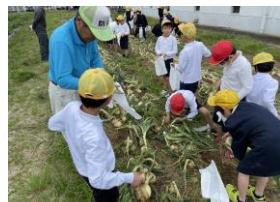
《文政小・玉ねぎの収穫》