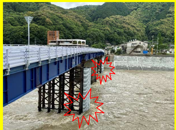
仮橋に河川流入物等が接触