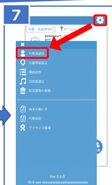
⑦配信一覧画面から、右上の「歯車」をタップ。→「利用者設定」をタップ。