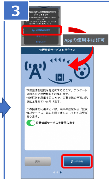
③位置情報機能の使用を許可。 (設定後もメニューから変更可能。)