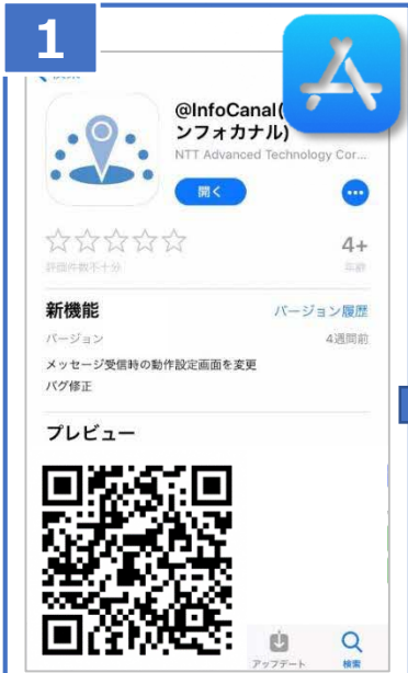
①QRコード ↑ を読み取り、App Storeから「@Info Canal」アプリをインストール。

※画面のレイアウトなどはお使いの機種やOSバージョンにより異なる場合がございますのでご注意ください。