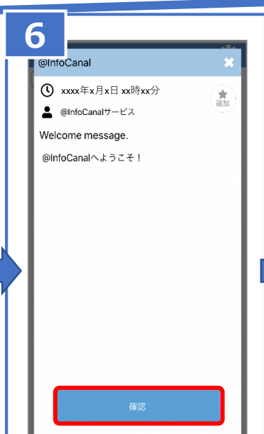
⑥「Welcome message.」が届いたら、「確認」をタップ。