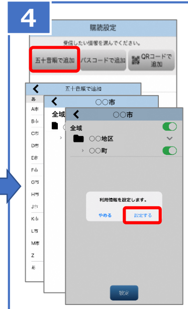
④購読設定で「五十音順で追加」から購読する地域を選択。