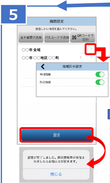
⑤「④で選択した地域」が表示されたことを確認して必ず「設定」をタップ。