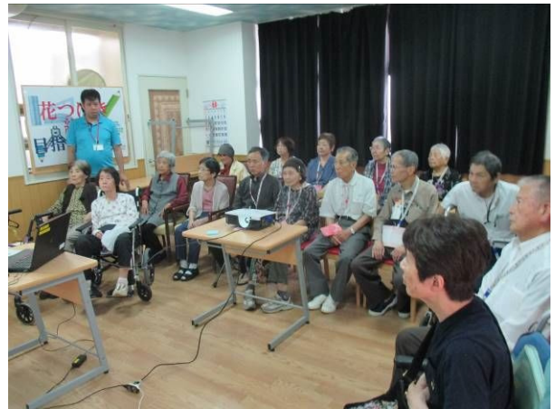
まちづくり出前講座の様子