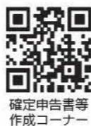
確定申告書等作成コーナー