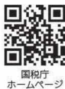
国税庁ホームページ

問合せ 国税相談専用ダイヤル ☎0570-00-5901 八代税務署 ☎32-3141※自動音声案内