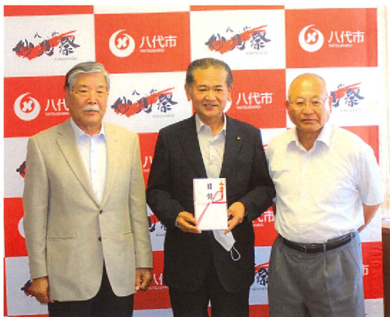
左より本田会長、中村市長、徳田組合長