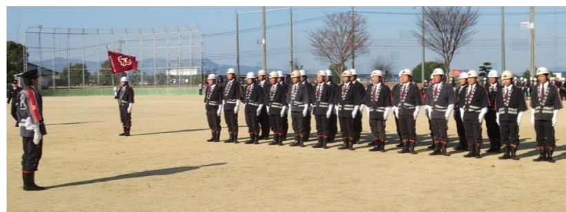
優勝した第1分団の点検