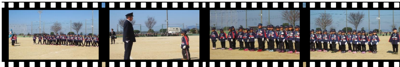
幼年消防クラブ(有佐保育園、文政保育園)