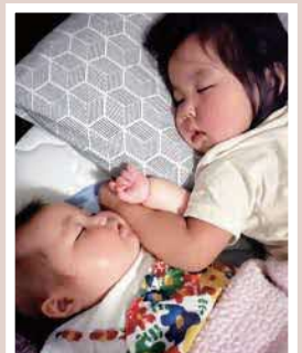
PN 凜 mamaさん