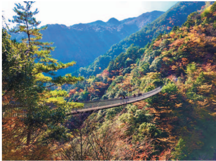
梅の木轟公園吊橋

問合せ 泉町紅葉祭実行委員会 (泉支所地域振興課) ☎672-111 五家荘観光案内所 ☎306-5000