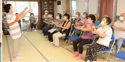
いきいきサロンの活動の様子