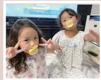
PN らいりーるママさん