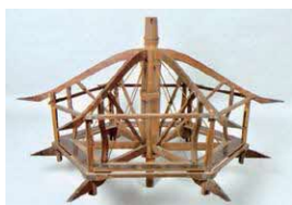
かさぼこぼんちょうかぶほねぐみ 笠鉾本蝶蕪骨組

開館時間 9:00～17:00(入館は16:30まで) 毎週月曜日 (月曜日が祝・休日の場合はその翌日)