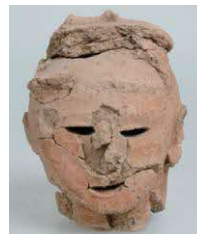
人物埴輪 大塚古墳出土 古墳時代(6世紀) 八代市教育委員会所蔵 八代市指定有形文化財

観覧料 10月15日(日)まで 一般310円 高大生200円 10月20日(金)から秋季特別展覧会のため 一般800円 高大生500円 ※中学生以下、障がい者手帳などを提示の人は無料