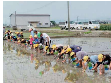
田植えボランティアの様子