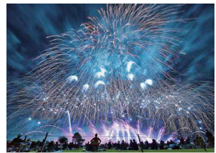
第35回やつしろ全国花火競技大会フォトコンテスト【最優秀賞】「天頂からの華嵐再び」鍋島明