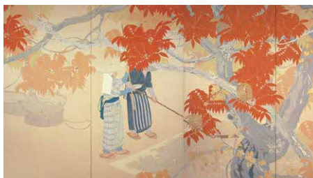
霜月頃(部分) 大正2年(1913) 熊本県立美術館蔵

観覧料 5月5日祝のこどもの日は無料 一般800円、高大500円、中学生以下無料 ※障がい者手帳を提示の人は無料