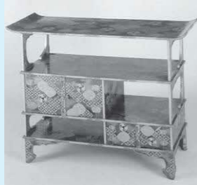
▲「七宝折扇蒔絵蒔絵結婚調度」から「厨子棚」江戸時代後期(19世紀)

現在松井文庫に残る婚礼調度のうち、最も豪華な一揃いです。写真の厨子棚は両開き扉が付いた置き棚です。全面が金銀の蒔絵で、おめでたい文様がちりばめられています。