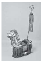
八代の木馬(市指定文化財)