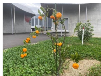
お祭りでんでん館に植えられている高田蜜柑