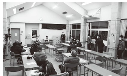
▲パブリックコメントの説明会

復興計画(案)については、パブリックコメントを実施し、1月4日(月)から2月2日(火)までの期間に、17件122項目のご意見をいただきました。また、計画案の説明会を3回開催する予定としておりましたが、県独自の新型コロナウイルスに関する緊急事態宣言を受けて、1月13日(水)のみの開催となりました。そこで、説明会の代替案として、計画の内容について、ケーブルテレビを使い1日3回(朝、昼、夜)、1月18日(月)～24日(日)の期間放映し、2カ所の仮設住宅団地にはDVDを配布し周知を図りました。