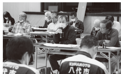
▲地域から質問・要望にお答えする会

第1回地域懇談会で提出された50項目の改善点・要望について、昨年11月18日(水)坂本中学校体育館で「地域から質問・要望にお答えする会」を開催し、早急の回答や意見交換を行いました。