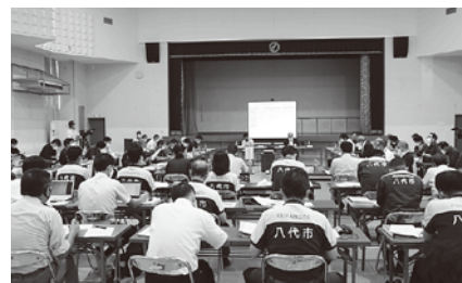
▲策定委員会・専門部会

「八代市坂本町復興計画」の策定に向けて、昨年9月14日(月)から、有識者等で構成する「復興計画策定委員会」を3回、専門部会を12回開催し、坂本町地域住民の皆さんのご意見、ご提案を計画に反映させながら住民の皆さんに寄り添った計画づくりを進めてきました。