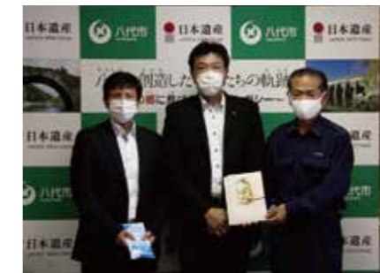
株式会社九州ガスホールディングス