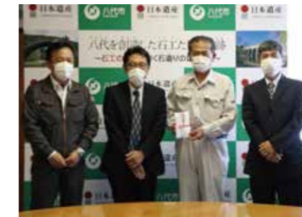
八代塗装・防水組合