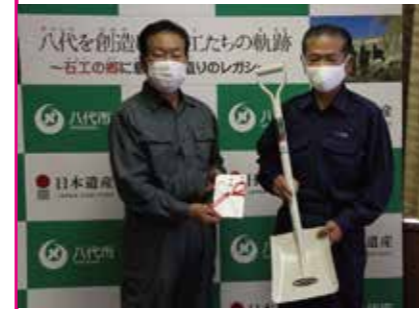
八代解体工事組合