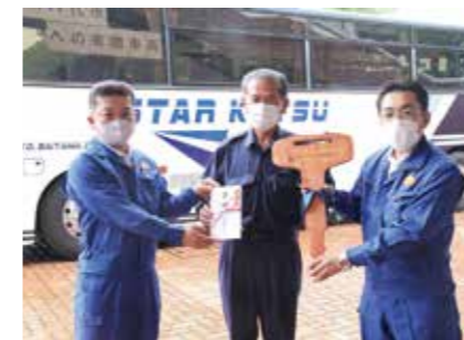
全国運輸環境協会

全国運輸環境協会から贈呈があった大型バスの車内には関係者からのたくさんの応援メッセージが書かれています