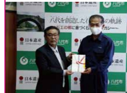
株式会社バイオマス開発機構