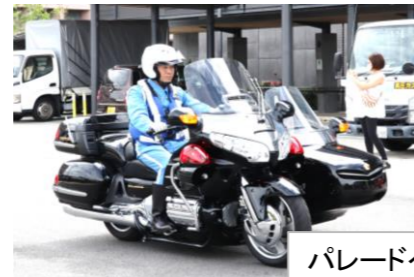
パレードへ出発の様子