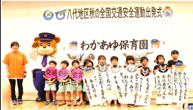
交通安全宣言をおこなう わかあゆ保育園の園児たち

出発式では、交通安全功労者表彰やわかあゆ保育園児によるアトラクションが行われました。式典後は、関係者などが見守る中、パトカー隊が市内のパトロールに出発しました。