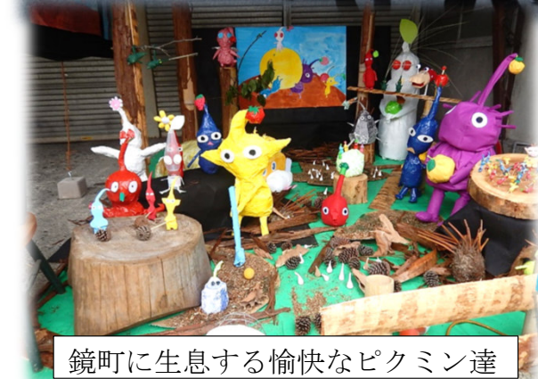
鏡町に生息する愉快的なピクミン達