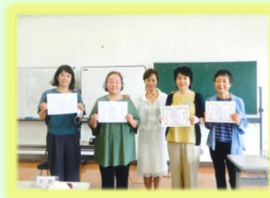
(写真) 7月11日 修了証書が授与されました。

以上、障害を持つ人の読書の手助けのための図書(デージー図書)の作製者として、聞き手に伝わる読みの技術を習得しました。