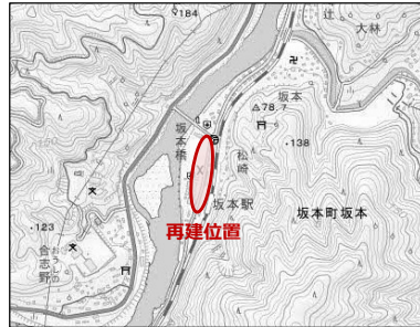
図1 再建位置の位置図