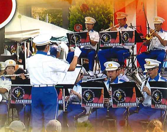
八代広域消防 音楽隊