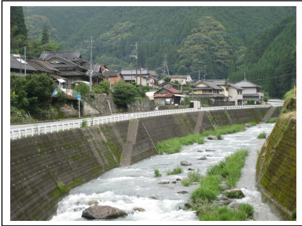
(河俣地区) 河俣川沿いに集落が点在しています

東陽地区は、氷川ダム（泉町下岳）より下流域に位置します。この地区は、生活排水の流入により農業用排水路の水質汚濁が進行し、住民の生活環境及び農業生産活動の両面に問題が生じていました。そこで、公共用水域の水質保全及び地域の衛生環境の改善を図るため、比較的に人口が集中している地域では、農業集落排水事業を平成12年度に供用開始し、その他の地域については、平成13年度より浄化槽市町村整備推進事業を進めてきたところです。