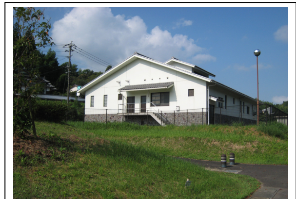
(農業集落排水処理施設)