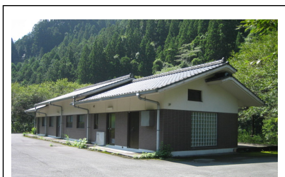
(農業集落排水処理施設)

注) 水道水源水域とは、水質汚濁防止法に規定する公共用水域であってその水が水道事業又は水道法に規定する水道用水供給事業のための原水として取水施設により取り入れられるもの及びその公共用水域にその水が流入する公共用水域をいいます。つまり氷川ダムに流入する河川、公共水路はすべて水道水源水域となります。