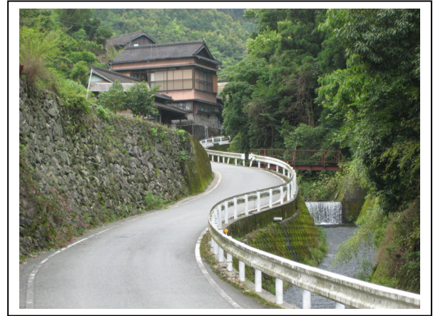
(箱石地区) 山間を縫うように走る水路と集落の様子