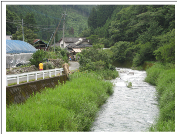
(河俣川の状況) 河俣・箱石周辺では蜚が飛び交います