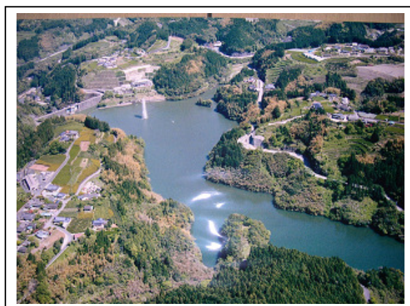
(氷川ダム：ダム湖の状況)