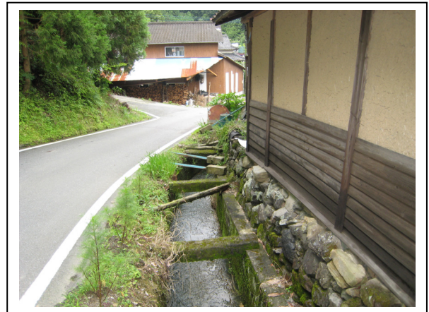
(箱石地区水路) 箱石では小さな水路が中心となっています。この地域の生活水路であると同時に下流域での農業用水利としても利用されています。