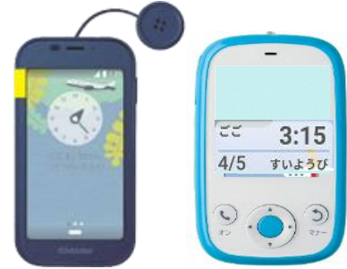
(携帯型は市が決めた要件を満たす場合のみ)