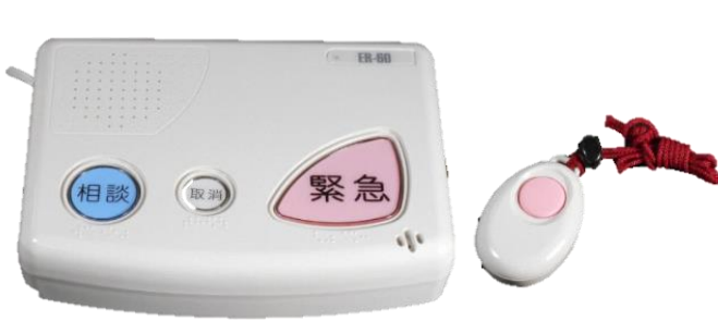
(本体装置＋ペンダント型)