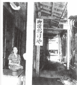
▲山頭火が昭和5年9月10日から3泊した木質屋「織屋」は、 今もそのまま温泉街の一角に残っています。