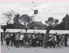
▲老いも若きも一緒に体育祭を楽しみます