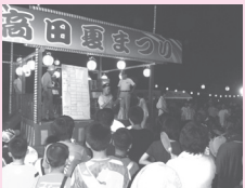
▲高田夏祭りはさまざまな協力を得て開催