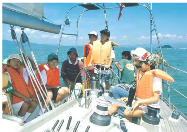
ボートセーリング

現在は、フリースクール遊び場を開設しています。また、秀岳館高校、私学高校、行政と連携し、不登校やひきこもりに対するサポートネットワークにも参加しています。