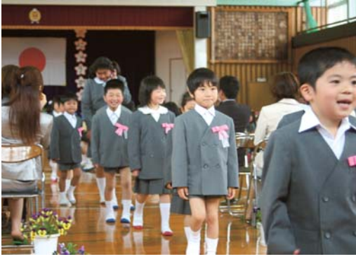
笑顔いっぱいの種山小新一年生

種山・河俣両小学校では少し大きめの制服に身を包んだ新一年生が在校生の拍手の中、嬉しそうに入場。式では在校生から「わからないことがあ