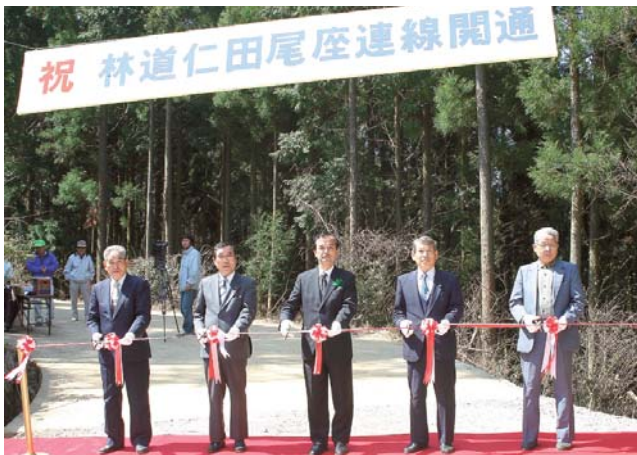
テープカットの瞬間