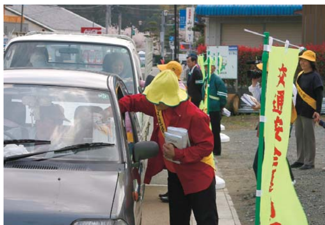
お気を付けて！安全運転の呼びかけ

四月八日(金)、東陽郵便局前において春の交通安全運動の一環として、宮原警察署、交通指導員、交通安全母の会、老人会、安全協会のみなさんが交通キャンペーングッズ、チラシを配布し、安全運転を呼びかけました。