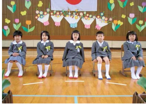
学校生活が楽しみな河俣小新一年生

つたら何でも聞いてください。仲良く遊びましょう」と新一年生へお祝いの言葉がありました。保護者のみなさんも我が子の学校生活に期待を膨らませていました。一年生の中には、先生や上級生と遊ぶのが楽しみな子・授業が楽しみだという子、今から始まる学校生活に期待いっぱいの様子でした。