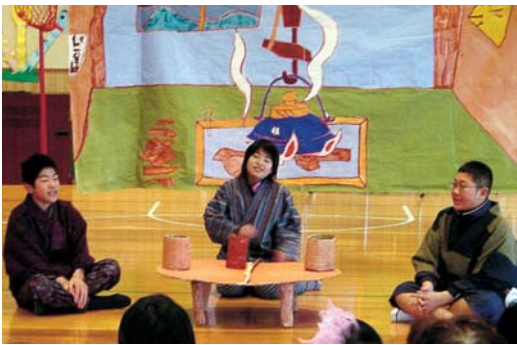
劇を披露する5・6年生

その中でも児童たちが授業の一環として箱石地区に伝わり伝統芸能である箱石雨乞い太鼓を取材し、劇にまとめた「箱石雨乞い太鼓誕生物語」やみなさんもご存知の「赤ずきんちゃん人形劇」などが披露され、会場からは多くの拍手や笑いでにぎわっていました。