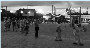
▲みんなが輪になって楽しく盆踊り

住民の皆さんが健康で、笑顔がはじけ、宮地に住んでよかった、と言われるまちづくりを目指します。総会、運営委員会や各部会で話し合いを重ねて、ぜひ今年も参加したい、と思ってもらえる事業を企画していきたいと思っています。