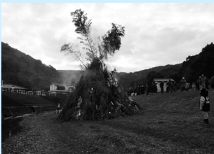
▲砥崎の河原でのどんどや