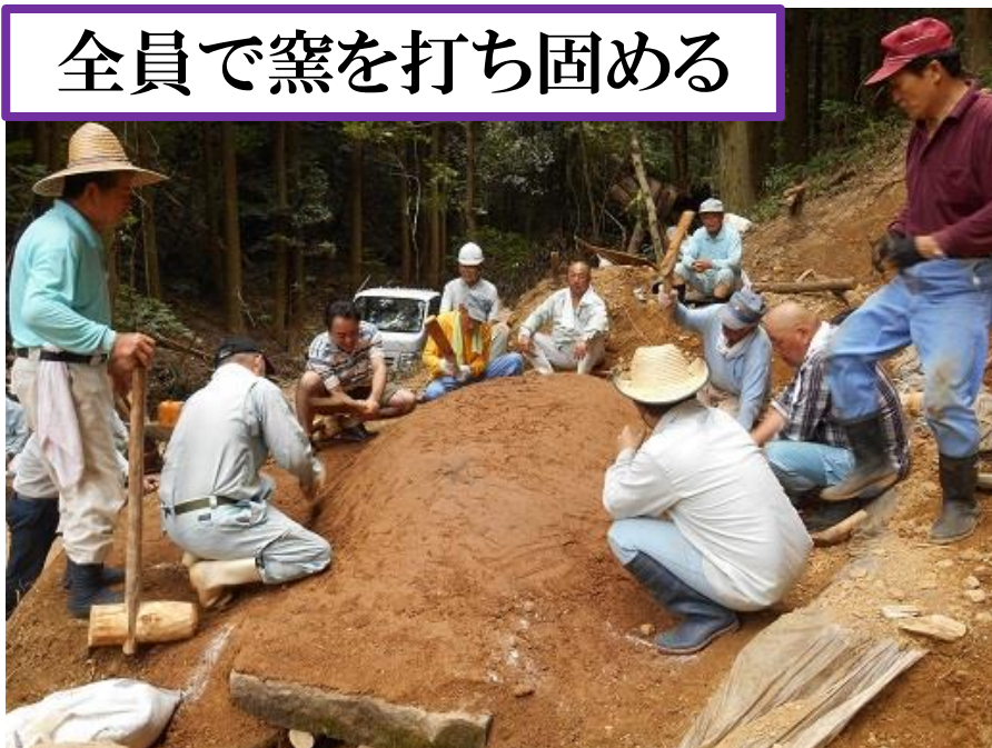
全員で窯を打ち固める