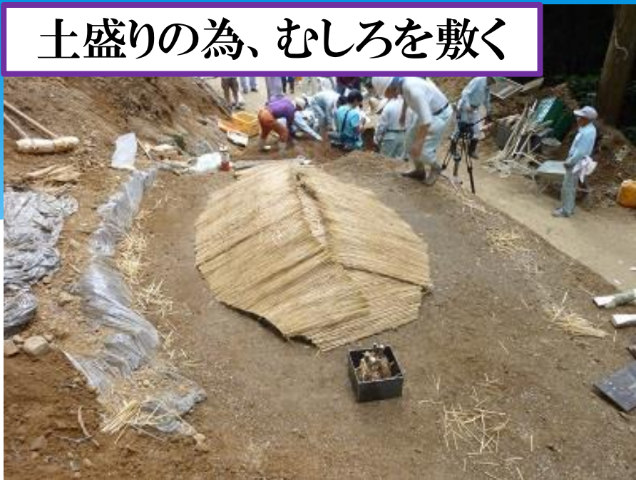
土盛りの為、むしろを敷く