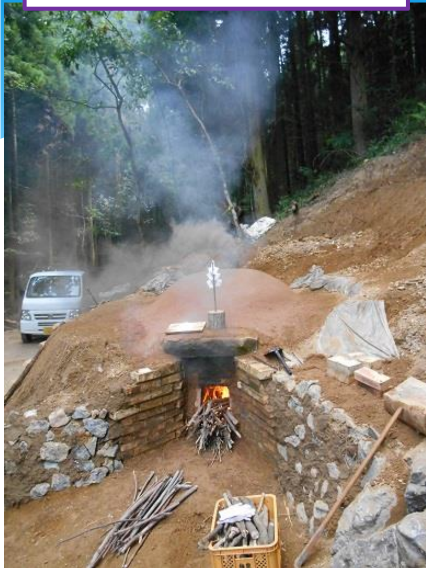
出来た窯に初火入れ