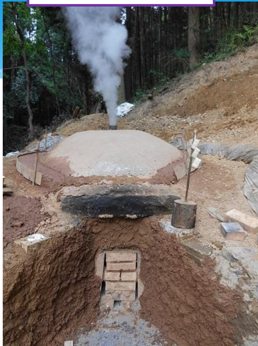
3日間燃やし続ける