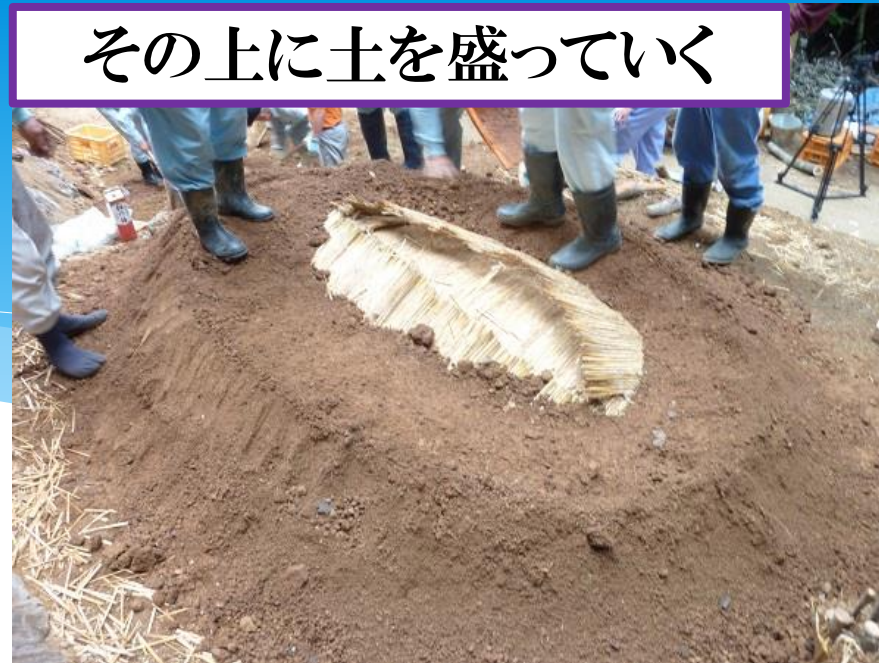
その上に土を盛っていく