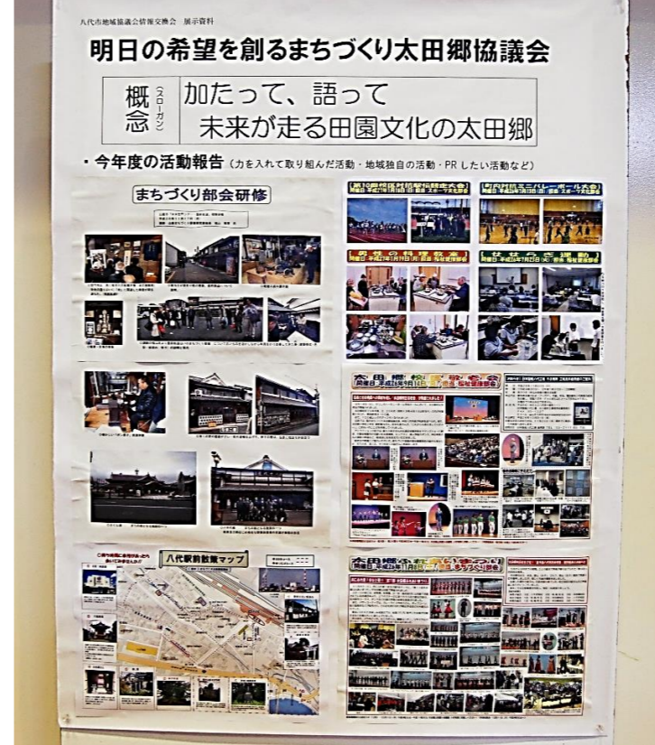
明日の希望を創るまちづくり大田郷協議会