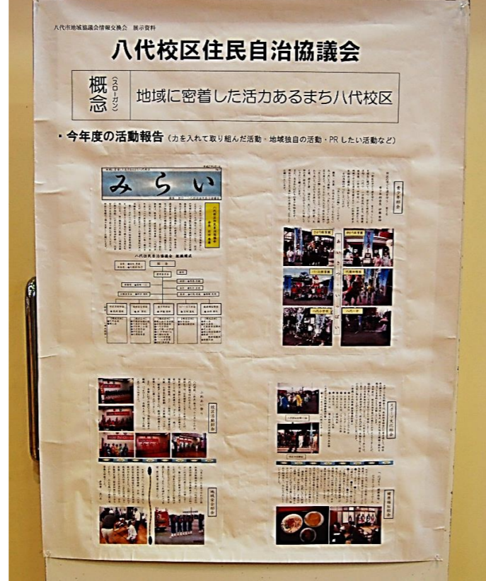
八代校区住民自治協議会