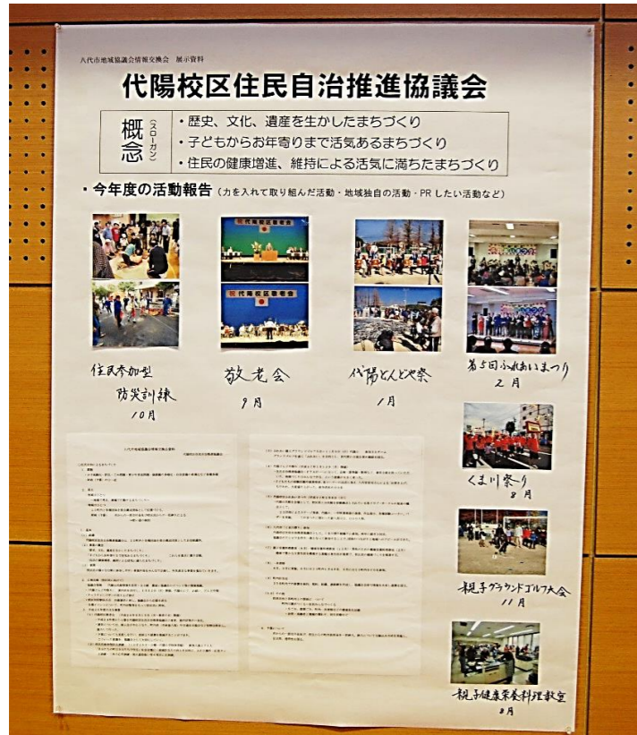
代陽校区住民自治推進協議会