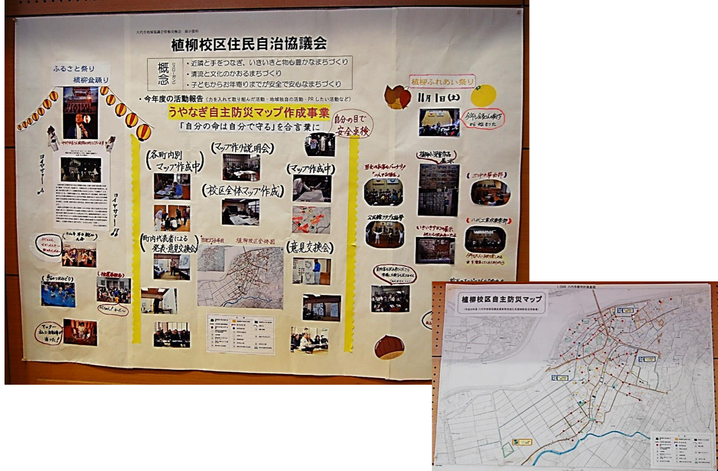
植柳校区住民自治協議会