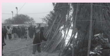
▲平成26年のどんどや

組織を担う人材の確保や自主財源の確保など、まちづくりを充実させるためにはまだまだ課題はありますが、これからも地域の皆さんの協力を得ながら協議会として知恵を絞り、課題解決に取り組んでいきます。