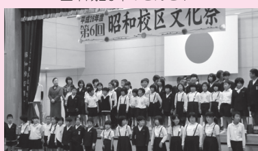
▲文化祭での昭和小ステージ