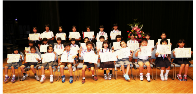
▲優秀賞を受けた27人の出場者の皆さん

7月25日、やつしろハーモニーホールで八代市童話発表大会が開催されました。この大会は、子どもたちの読書意欲の向上を図り、豊かな人間性を育成するために毎年実施されています。今年は命や戦争、環境、福祉、社会問題をテーマにした話が多く、子どもたちのすばらしい発表に涙を浮かべながら聞き入る人の姿が見られました。