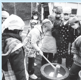
▲1列になつての田植え作業 ▼杵と臼を使つての餅つき体験