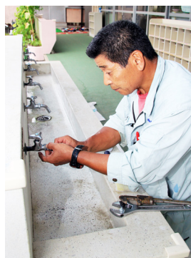
▲吐水パイプを取り外し、蛇口内部を点検

8月8日、市管工事業協同組合の職員18人が、太田郷幼稚園の水道蛇口などの点検を行いました。同組合が平成17年から行っている道路清掃ボランティア以外にも、専門知識や技能を生かし地域に貢献したいという思いから始められたもので、今回が初めての点検作業となります。 水栓器具点検では、吐水パイプと蛇口の接続部分の緩みやさび、ゴムパッキンの劣化具合などを確認・調整。さびを落とし拭き上げると、新品のように綺麗になりました。