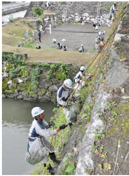
▲八代城跡での除草作業

8月2日、NPO法人しらさぎ（白鷺電気工業）や協力事業所の職員など約150人が、ボランティアで八代城跡と水島の除草作業を行いました。 これは、同法人が高所での作業技術を活かして地域の誇りである文化財の美化に貢献しようとしており、今年で15回目（水島は7回目）になります。八代城跡では、ロープやはしごを使って石垣を上り下りしながら手やカマで除草。水島の草などはボートを使って回収しました。水島では、岩の間に生い茂った草をカマなどで刈り取っていききました。