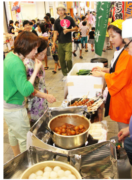
▲玉こんにやくを試食

東京板橋区で本市をはじめ全国15の市町村から直送された野菜や加工品などを販売している、全国ふる里ふれあいショップ「とれたて村」。商店街同士の交流を深めようと、8月2日の土曜日に合わせ本町商店街で1日限りの出店を行いました。 販売したのは、山形県最上町の玉こんにやくをしようゆで煮込んだ串や、和歌山県田辺市の梅干しをつぶし、きゅうりにまぶした梅キユーなど。買い求めておいしそうにほおばる姿が見られ、すべて完売の盛況ぶりでした。