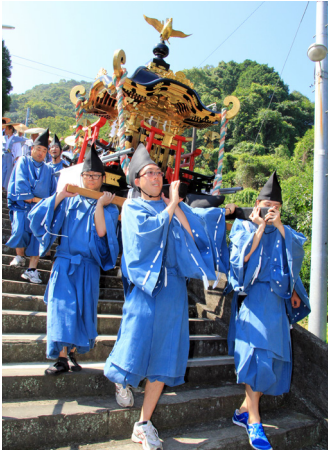
▲温泉街へ繰り出すみこし

7月28日と29日、日奈久温泉街一帯で「日奈久温泉丑の湯祭り」が行われました。このお祭りは約600年前、日奈久温泉が発見された日が「土用丑の日」であり、この日に温泉に浸かれば千日分の効能が得られると言われることにちなんで始められました。