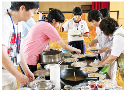
▲器にラップを敷いて食事を盛り、節水に努める参加者

地震や大雨による災害発生時に適切な対応ができるよう行動や知識を身につけることを目的に、8月1日から3日までの2泊3日、坂本中学校の体育館で生徒や保護者、地域住民など約70人が参加し坂本防災教育キャンプが開催されました。電気のない体育館で過ごしたり、与えられた水を工夫しながら使う節水の大切さなどを学びました。また、薪を使った釜での調理やドラム缶風呂などを体験したほか、過去に地域で発生した災害などについて学びました。