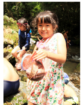
▲「塩焼きにして食べます」

7月28日、せんだん轟駐車場横のヤビツ谷でヤマメつかみ取り大会が行われました。泉町ヤマメつかみ取り大会実行委員会が毎年開催しているもので、今回で26回目。市内外から213人の親子連れなどが参加しました。せき止められた川に放流されたヤマメは約2000匹。参加者は、制限時間10分間でより多くのヤマメを捕まえようと、腰や胸まで川に浸かり、岩や石の下に腕を伸ばしました。初めは苦戦していた子どもたちも、川の浅瀬に追いやるなどして上手に捕まえていました。