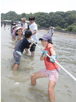
▲大漁の網はずつしりと重い

陸地から網のロープを引き寄せて漁をする「地引網体験」が大島地先であり、一般公募で集まった小中高生とその保護者ら約200人が参加しました。海や漁業のことを知って魚をたくさん食べてもらおうと毎年開催されており、今回で22回目です。船で仕掛けた網から延びた長さ約200mのロープを「よいしょ、よいしょ」と元氣いっぱい引くこと20分。約100尾30kgの獲物が揚がり、子どもたちは飛び跳ねる魚に歓声を上げました。