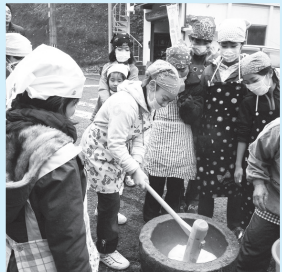
▲1列になつての田植え作業 ▼杵と臼を使つての餅つき体験