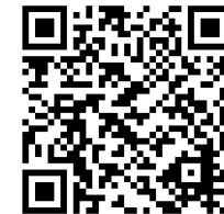
団体登録について