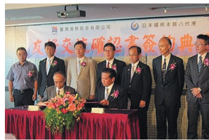
③八代港・基隆港友好交流確認書調印