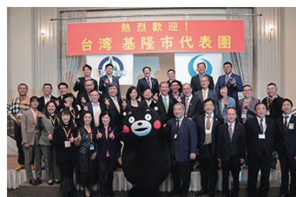
⑥基隆市使節団が八代市を訪問