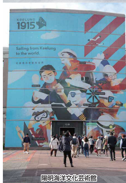
陽明海洋文化芸術館