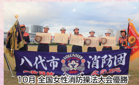
10月 全国女性消防操法大会優勝