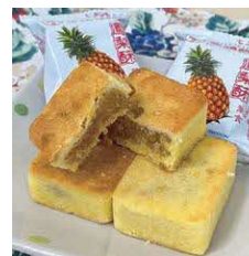
パイナップルケーキ