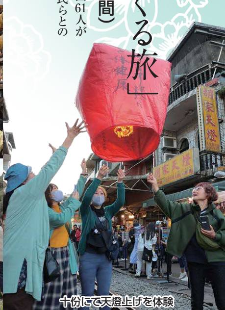
十份にて天燈上げを体験