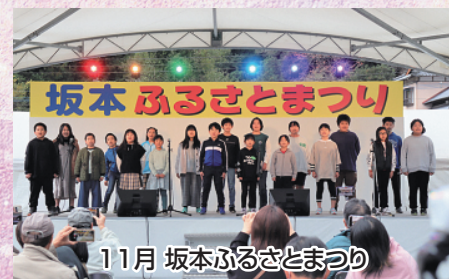
11月 坂本ふるさとまつり

また、昨年末、熊本県が「八代地域における県営工業団地の整備」を表明されたことは、本市にとりて大きな追い風であり、一日も早い実現に向けて全面的に協力してまいります。