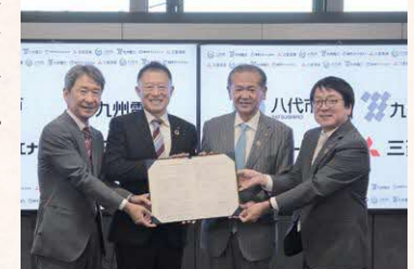
▲八代市におけるカーボンニュートラルの早期実現に向けた取組に関する協定締結式