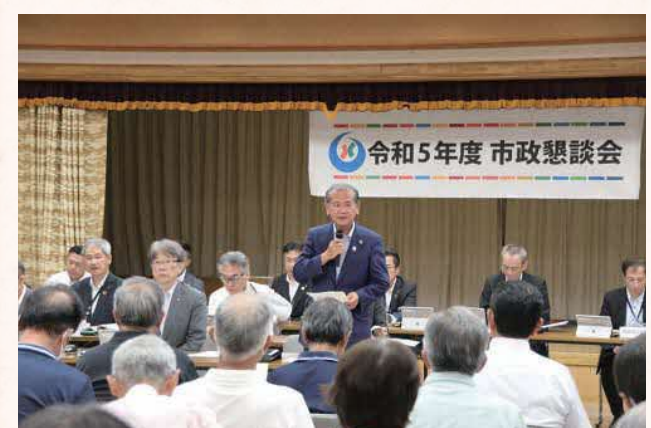
▲市政懇談会の様子