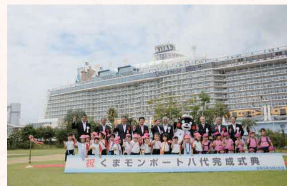
▲くまモンポート八代完成式典