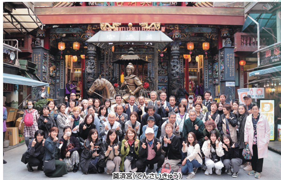
奠濟宮(てんさいきゅう)