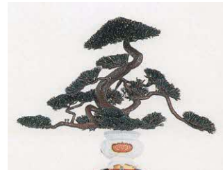
【笠鉾展示】～1月27日(土) かさぼこまつ 笠鉾松

観覧料 一般300円、高大200円、中学生以下無料 ※各種割引などあり。詳しくは問い合わせください