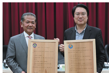
⑤友好交流協定締結1周年記念