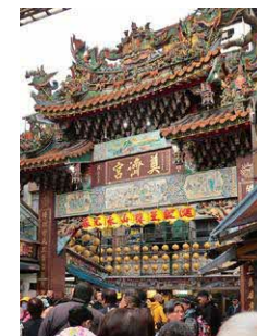
奠濟宮(てんさいきゅう)