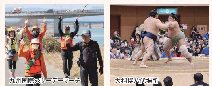
九州国際スリーデーマーチ 大相撲八代場所 やつしろ全国花火競技大会

「第28回九州国際スリーデーマーチ2023」、「第56回八代くま川祭り」、「第36回やつしろ全国花火競技大会」、「大相撲八代場所」などが開催されました。