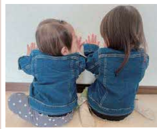
PN KR まま