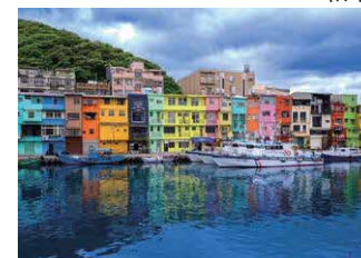
正濱漁港(カラフルハウス)