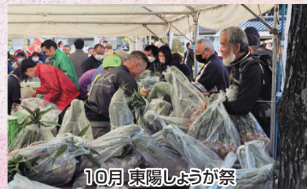
10月 東陽しょうが祭