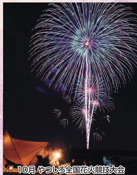
10月 やつしろ全国花火競技大会