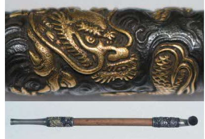
龍文煙管 釘谷洞石作 明治時代 個人蔵

観覧料 一般310円 高大生200円 ※中学生以下、障がい者手帳などを提示の人は無料