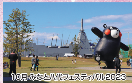
10月 みなと八代フェスティバル2023