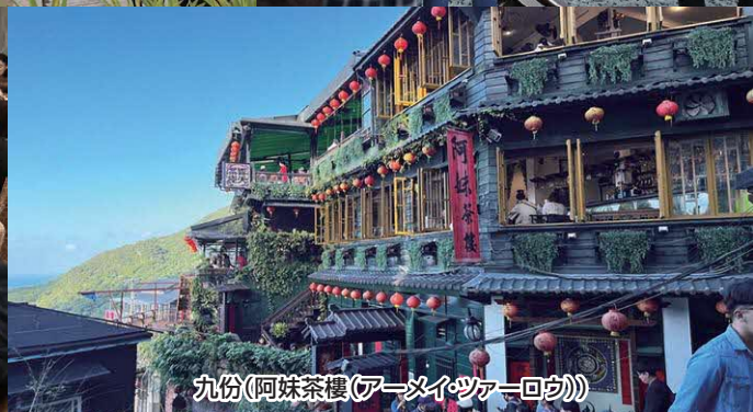
九份(阿妹茶樓(アーメイツアー回廊))

台湾に行ってみたくて、親の勧めもあり参加しました。台湾の人はすごく優しく、日本語も通じて、夜市のおすすめなどを教えてもらいました。基隆の夜市は提灯がたくさんあり、人も多くて、お祭りみたいで楽しかったです。普段話すことのない人と接することができ、いい経験になりました。