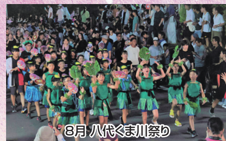
8月 八代くま川祭り