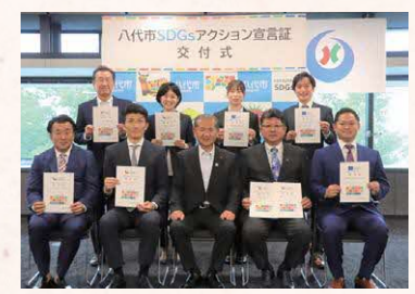
▲八代市 SDGs アクション宣言証 交付式