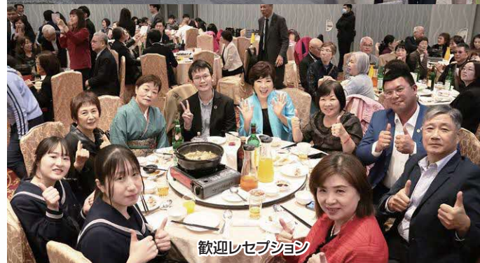
歓迎レセプション