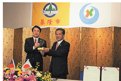
④友好交流協定締結