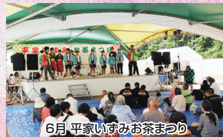
6月 平家いずみお茶まつり