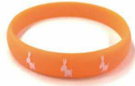
講座の受講者に贈られるオレンジリング