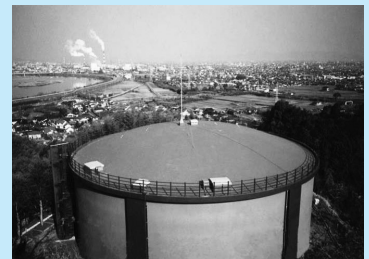
▲八代配水池 (古麓町)