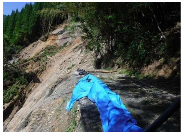
令和4年台風14号の被害状況 (八代市泉町八八重～四方田線：被災箇所①)