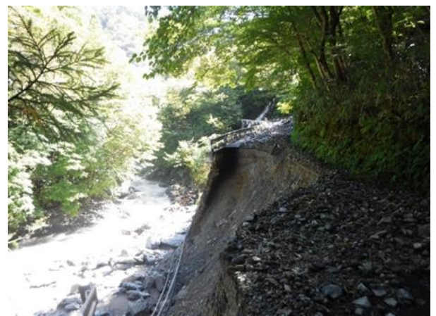
令和4年台風14号の被害状況 (八代市泉町五家荘～椎葉線：被災箇所③)