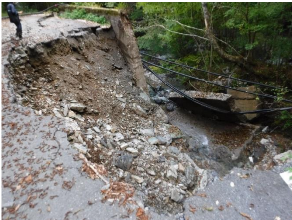
令和4年台風14号の被害状況 (八代市泉町五家荘～椎葉線：被災箇所④)